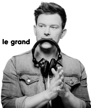
fedde le grand

onze dj's praten over jouw merk, feest of een interview op de radio