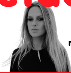
nora en pure